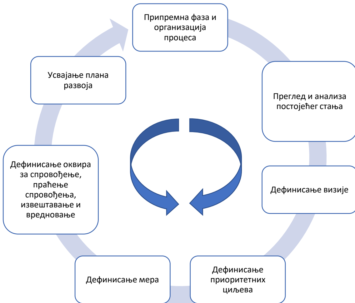
Дијаграм 1. Фазе процеса израде Плана развоја општине Шид

На претходном дијаграму јасно су приказне фазе процеса израде и њихов след. Основне фазе процеса израде Плана развоја општине Шид за период 2022 – 2028. биле су: